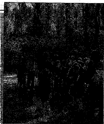
Studenti. Una delle uscite dello scorso anno

che che la scienza idraulica ricordi. Il risultato di questa esperienza sarà la realizzazione di un'edizione della rivista locale "Notizie da Spoleto", con una presentazione che si terrà lunedì 28 maggio 2018 nel Palazzo Comunale di Spoleto.